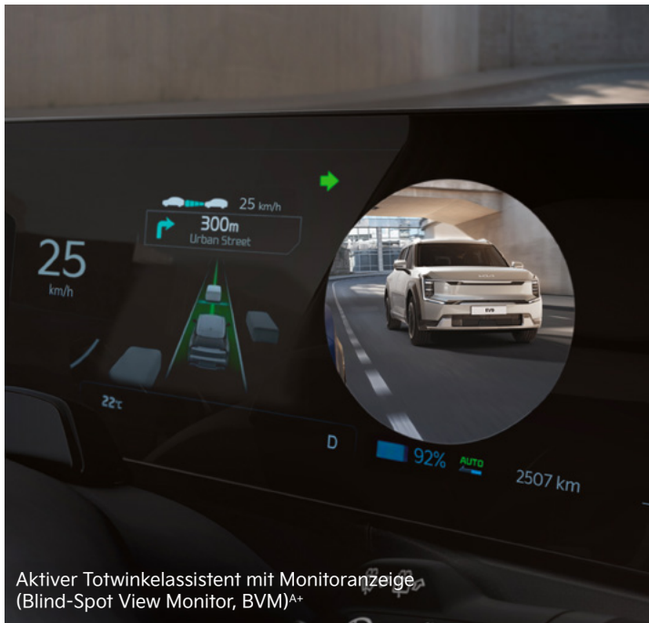
Aktiver Totwinkelassistent mit Monitoranzeige (Blind-Spot View Monitor, BVM) A+

Mit einem breiten Spektrum an aktiven Sicherheitssystemen A unterstützt dich der Kia EV3 dabei, in Gefahrensituationen schnell und angemessen zu reagieren.