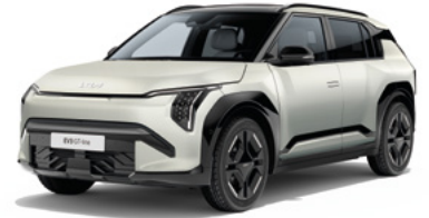
Ivory Silber Matt (ISM)